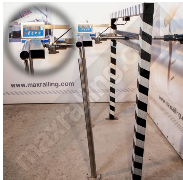
Височина 105см. 1000N