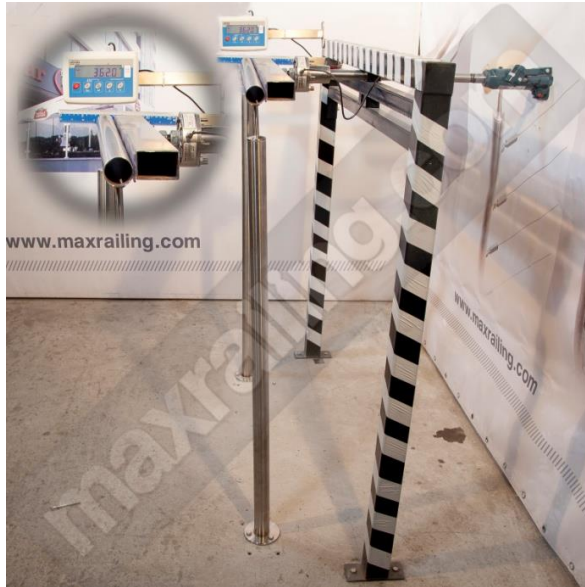
Височина 120см. 360N