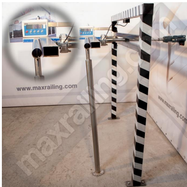
Височина 105см. 730N