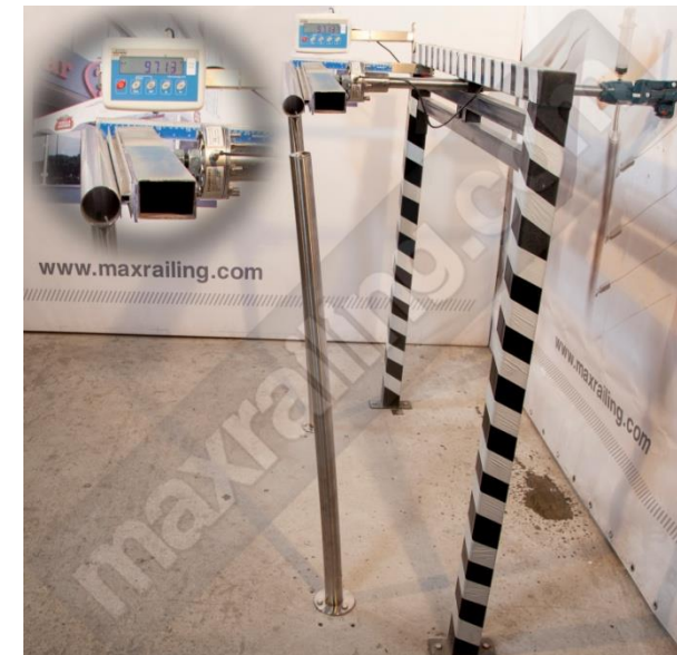
Височина 120см. 1000N