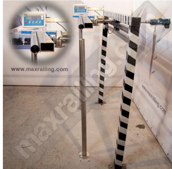
Височина 120см. 360N