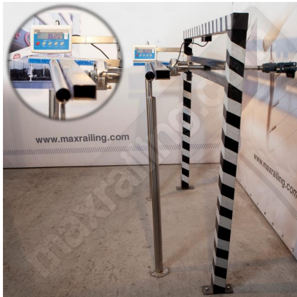
Височина 105см. 360N