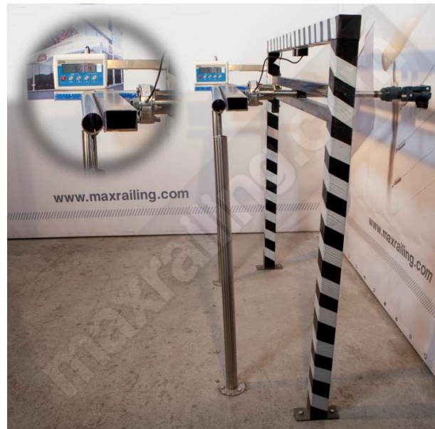
Височина 105см. 500N