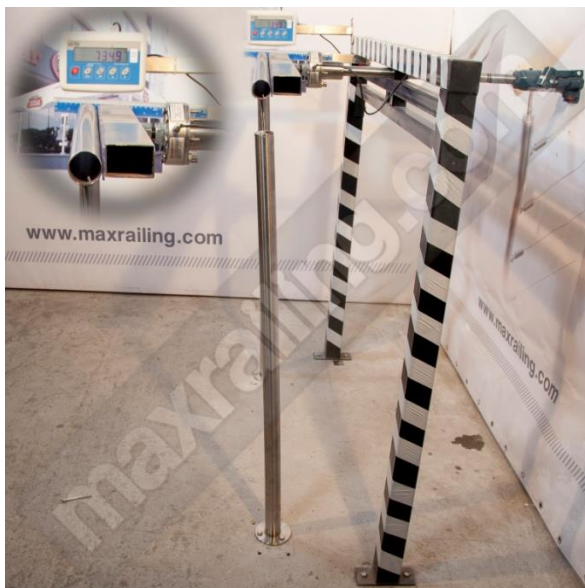
Височина 120см. 750N