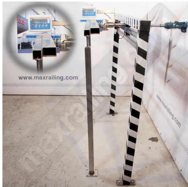
Височина 120см. 500N