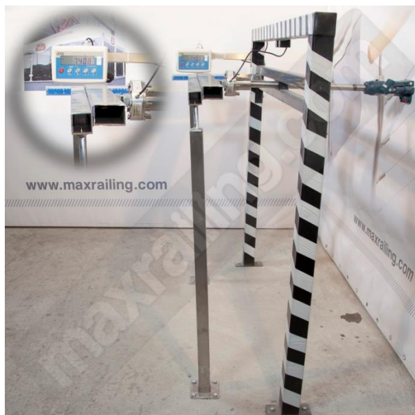
Височина 105см. 750N