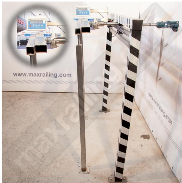
Височина 120см. 750N