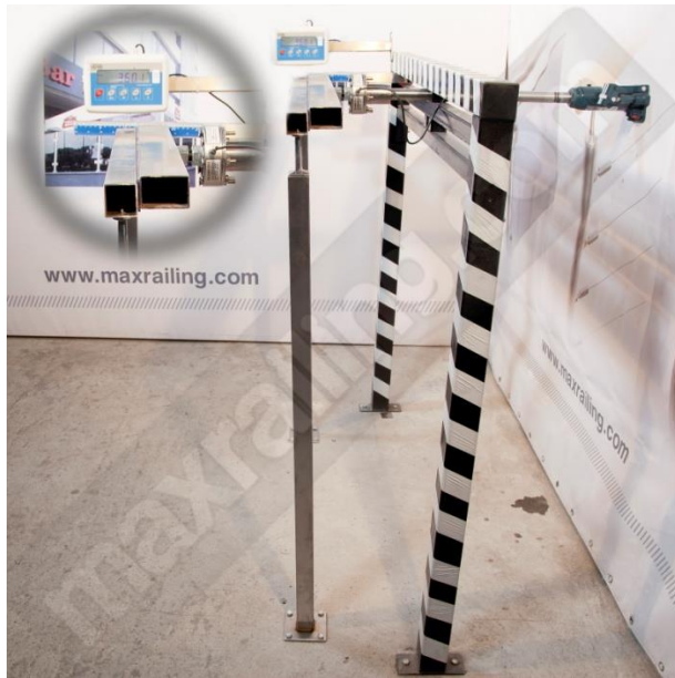
Височина 120см. 360N