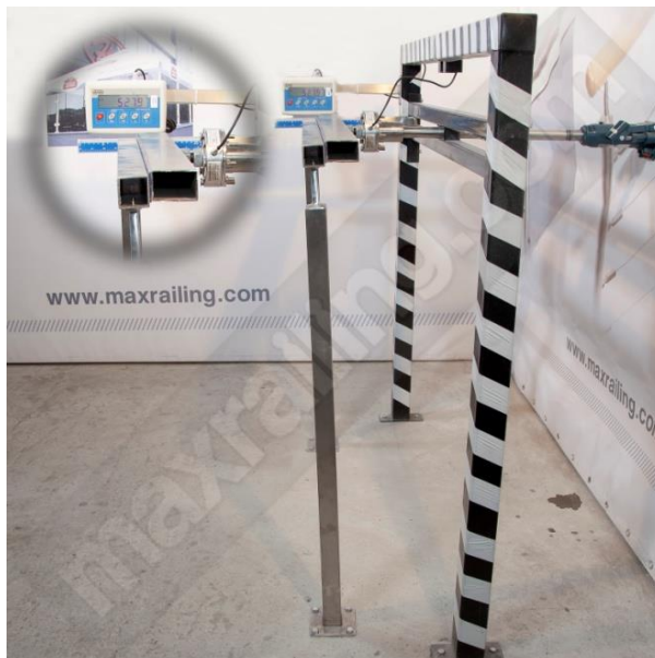
Височина 105см. 500N