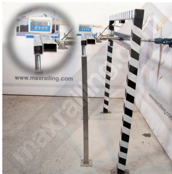
Височина 105см. 1000N