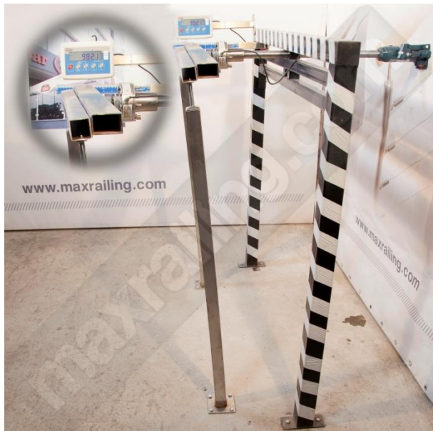
Височина 120см. 1000N