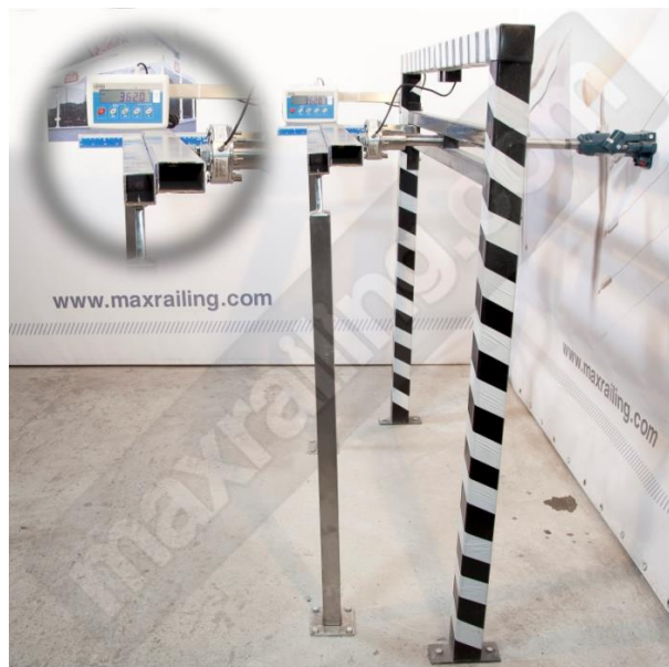
Височина 105см. 360N